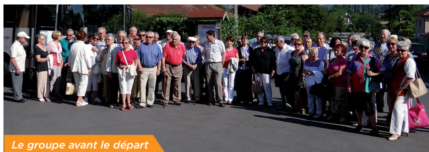
Le groupe avant le départ