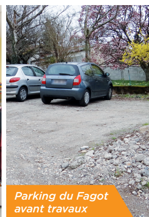
Parking du Fagot avant travaux